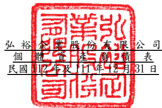
弘裕企業股份有限公司 個體資產負債表 民國112年及111年12月31日