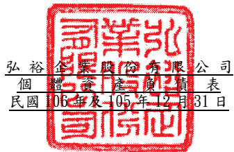
弘裕企業股份有限公司 個體資產負債表 民國106年及105年12月31日